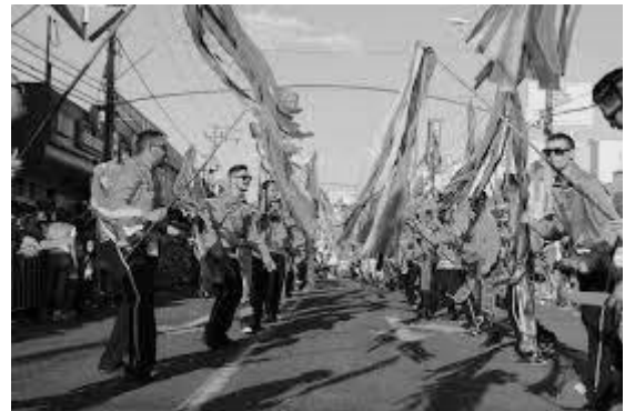
Foto 2: Disponível em: < http://www.catalao.go.gov.br >. Acesso em: 18 jun. 2019.

Foto 1: Disponível em: < http://www.ngnoticiasnovaguarita.com.br >. Acesso em: 18 jun. 2019.