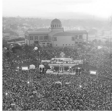
Foto 1: