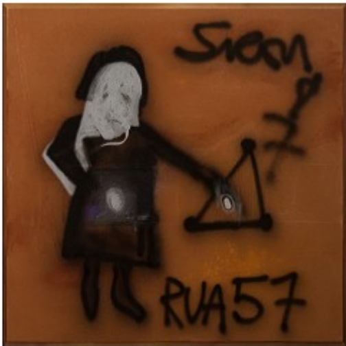
Siron Franco. Sem título. Rua 57. 1987

O quadro de Siron Franco remete a qual acontecimento histórico em Goiás?